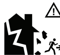
Les autres acteurs : BRGM, associations agréées de sécurité civile, etc.